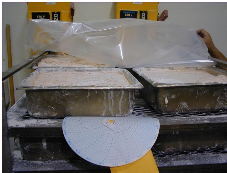
Après broyage, élimination de toutes particules métalliques et lavage le feldspath décante et sèche

Lavé à l'eau, il sédimente ensuite et sèche en pains dans des moules de décantation.