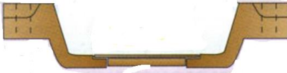
COULEE DE LA CONTRE PARTI