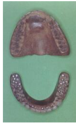
dentier sculpté dans le bois

Ce n'est qu'à l'aube du XXe siècle qu'elle acquerra ses titres de noblesse, grâce aux progrès de la science et de la technologie. A l'esthétisme, dont le rôle est toujours aussi important, vient désormais s'ajouter le souci de restaurer une fonction lésée avec tout ce que cela implique de connaissance et de savoir-faire.