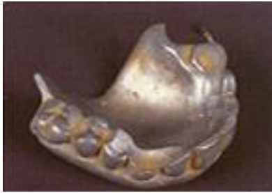
Denture fabriqué en aluminium 1914

Ce n'est qu'à l'aube du XXe siècle qu'elle acquerra ses titres de noblesse, grâce aux progrès de la science et de la technologie. A l'esthétisme, dont le rôle est toujours aussi important, vient désormais s'ajouter le souci de restaurer une fonction lésée avec tout ce que cela implique de connaissance et de savoir-faire.