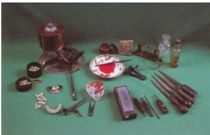
Les outils rudimentaires de l'époque

Vers le milieu du XXe siècle que le nom de prothésiste dentaire apparaît. Les ancêtres des prothésistes dentaires sont les "mécaniciens-dentistes", terme utilisé jusqu'au XIXème siècle. L'arrêté ministériel du 31 mai 1974 substitue définitivement le terme de mécanicien-dentiste par celui de prothésiste dentaire.